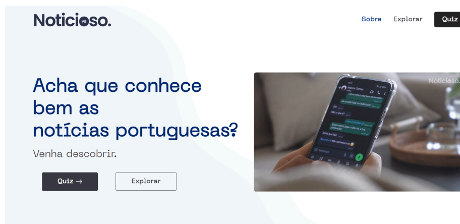
Figura 4. Página principal (acessível em noticioso.pt ).

Os resultados alcançados incluem o desenvolvimento de uma plataforma web ( noticioso.pt ) interativa e estimulante, disponibilizada ao público em geral. Esta plataforma, de navegação rápida e intuitiva, permite aos utilizadores interagir com as duas funcionalidades anteriormente explanadas, o Quiz e o Explorar .