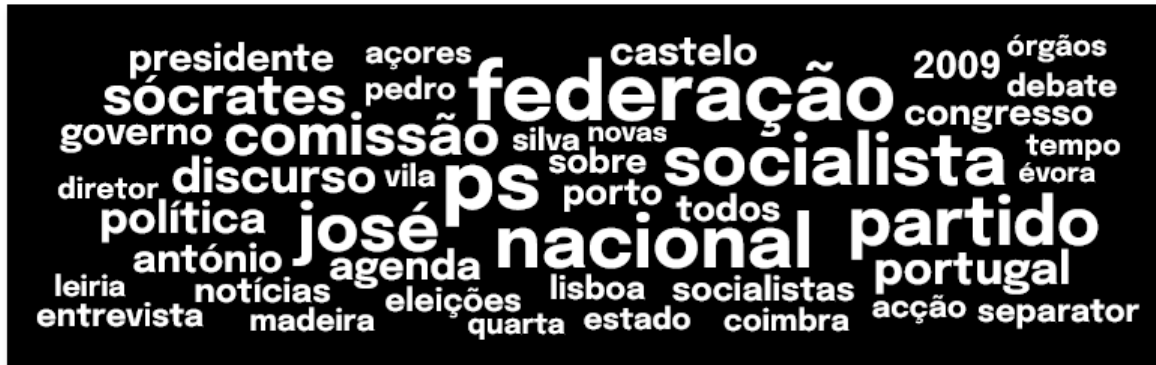
Palavras Mais Frequentes para o Partido

O Partido Socialista (PS) é um partido político fundado a 19 de Abril de 1973 por militantes da Acção Socialista Portuguesa (ASP) sendo o seu espectro político de centro-esquerda.