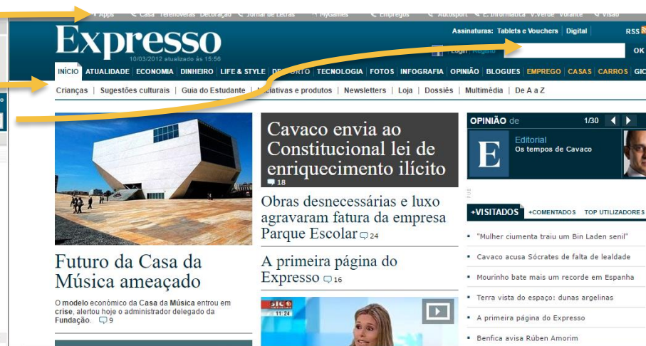
Expresso, 10-03-2012, 16:02