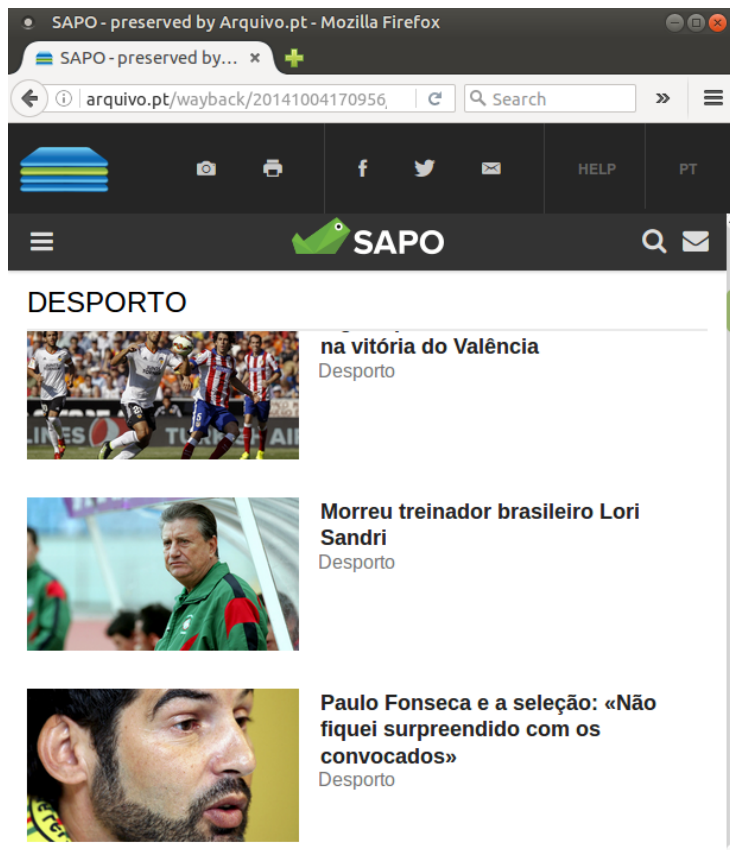
Figura 2: Versão Tablet da ReplayBar do Arquivo.pt